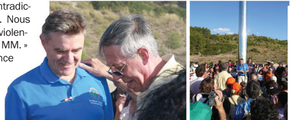
La salle du Parc de Tolède, De la Rubia avec Silo et au Monolithe

supplémentaire pour sortir définitivement de la pré-histoire humaine. »