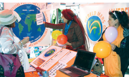
Campagne d'adhésions à Amsterdam

La troisième étape de la campagne d'adhésions aura lieu du 4 au 14 septembre prochain.