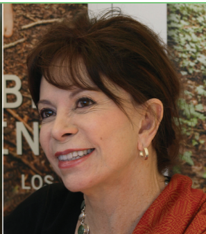
Isabel Allende CHILI LITTÉRATURE

Pour conclure, les participants ont réalisé un symbole de la paix sur la place de l'Indépendance.