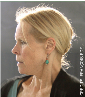
Carolyn Carlson FRANCE DANSE

Isabel Allende est l'auteur de «La maison des esprits», «Eva Luna» et «Paula», parmi beaucoup d'autres publications. Auparavant, elle a été journaliste d'un magazine féminin chilien, pour des shows TV et de documentaires. Elle s'est vu décerner des titres honorifiques dans son Chili natal, aux USA et en Italie et a gagné de nombreux prix partout dans le monde comme écrivain et comme féministe.