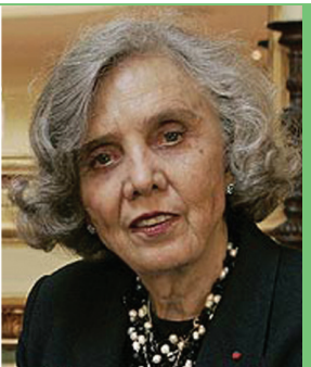
Elena Poniatowska MEXIQUE LITTÉRATURE

David Suzuki est un militant écologiste canadien, divulgateur scientifique dans les médias. Il a été l'animateur populaire de la célèbre série télé "La nature des choses", diffusée dans plus de 40 pays, ce qui l'a rendu célèbre. Il est également connu pour sa critique sur l'inaction du gouvernement en matière de protection de l'environnement et il a écrit plus de 40 livres.