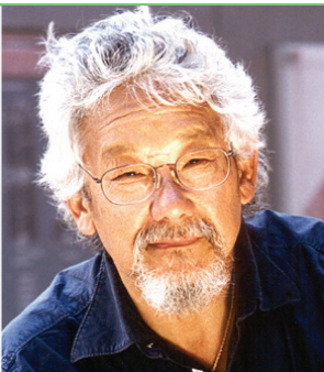
David Suzuki CANADA ÉCOLOGIE

Chumpitaz est un célèbre ex-footballeur péruvien. « J'en appelle à toutes les personnes, à tous les compagnons du sport en général, de toutes disciplines, parce que cette Marche va être très importante, elle va engendrer ce qui devrait exister entre les humains, l'amitié, la tendresse, l'estime. J'en appelle à toutes les personnes du Pérou particulièrement pour qu'elles soutiennent cette grande Marche pour la Non-violence. »