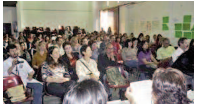
Instituto de la Matanza, Gran Buenos Aires

Más tarde, se formaron grupos de trabajo entre los presentes, que prepararon propuestas de actividades en las escuelas para la promoción de los temas de la Marcha entre los alumnos. Como material de apoyo se utilizó el manual "Nos ponemos en marcha" .