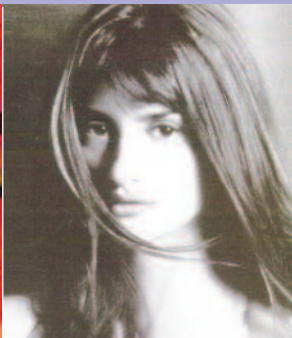
Penélope Cruz ESPAÑA TV-CINE-TEATRO

Famosa cantante y compositora alemana, conocida internacionalmente por su larga carrera artística (desde 1977) y por sus abundantes apariciones en los medios de comunicación, en los que siempre ha mostrado su postura social y política. En grupos y en solitario, su trayectoria musical se ha ampliado con apariciones en el cine; la última, el doblaje de The Nightmare Before Christmas , de Tim Burton.