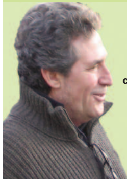
Miguel Ríos y la Marcha Mundial en el concierto

Gran pacifista, el cantante aprovechó para difundir la MM y anunciar su paso por Madrid el próximo 14 de noviembre: "Estoy convencido que, algún día, Charly García no tendrá que cantar nunca más este tema, porque a ningún ser humano le golpearán abajo por ninguna razón; ninguna razón, ni de sexo, ni de religión, ni de cultura, ni de color de la piel, ni de cualquier causa, ni diferencia social, económica. Cualquier ser humano será 'per se' la joya del universo, la cosa más importante del mundo. Para que eso suceda, os animo a uniros a la Marcha por la Paz y la No-violencia, que pasará por Madrid en el mes de noviembre, porque queridos amigos... es un sueño, ¡pero se hará realidad!".