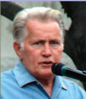
Martin Sheen ESTADOS UNIDOS TV-CINE-TEATRO

Declaró que su gobierno y el pueblo ecuatoriano recibirán al equipobase de la Marcha a su paso por Quito el 18 de diciembre. Y finalizó con un llamamiento a la adhesión de todos los líderes políticos, sociales, culturales y religiosos del mundo, a través de un poema de Rafael Alberti.