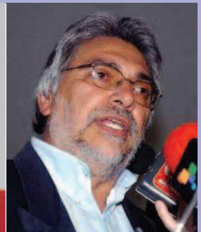
Fernando Lugo PARAGUAY POLITICA

Su Santidad el XIV Dalai Lama, Tenzin Gyatso , es un líder espiritual del Tíbet. Vive en el exilio en Dharamsala, al norte de la India. En 1989, fue galardonado con el premio Nobel de la Paz, que le dio mayor notoriedad mundial. Ha sido motivo de varias películas de Hollywood ( Siete años en el Tíbet y Kundun ) y de numerosos documentales y programas de televisión.