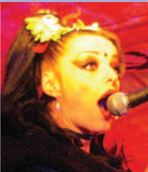
Nina Hagen ALEMANIA MÚSICA

Martin Sheen es muy conocido por su actuación en la película Apocalypse Now y la serie televisiva The West Wing . Además de la buena crítica que ha recibido como actor, es activista y partidario de la justicia social.