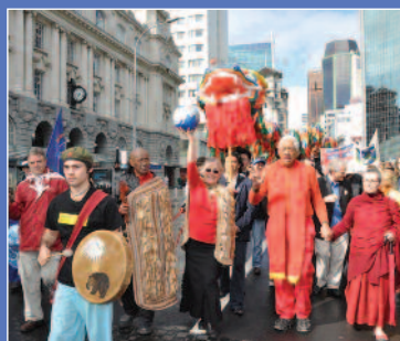
el equipo-base con el pueblo moriori y marchando en Auckland